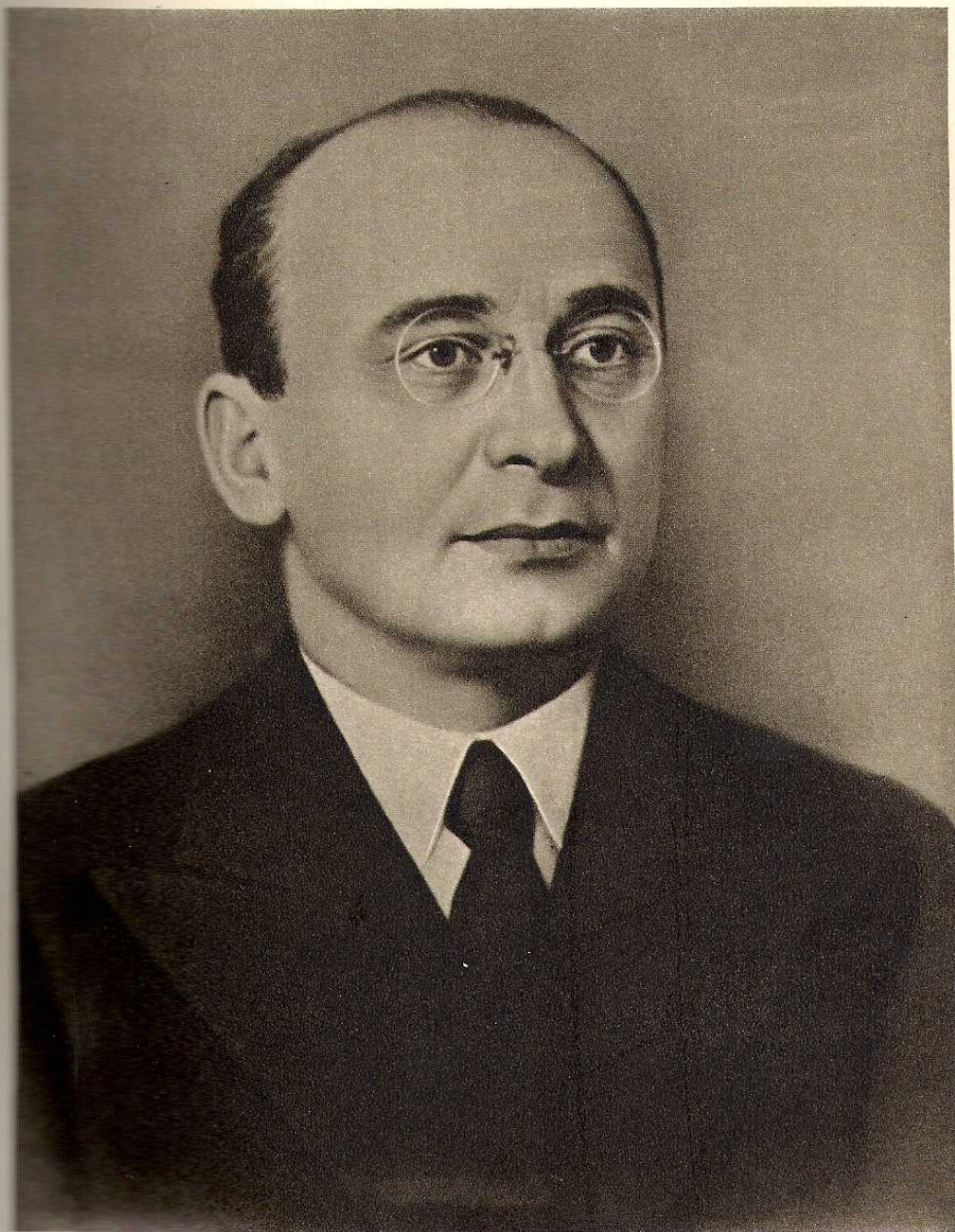
Л. П. БЕРИЯ.